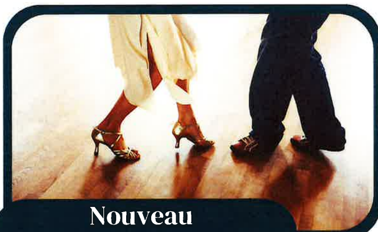
Nouveau programme de danse