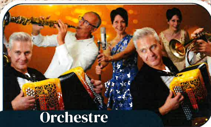
Orchestre Thierry Coudret

Et les célèbres "Koudourou", "Le Galtic", "La Cumbia semana" et "La Bachata mi amor" ! Et qui aurait imaginé "La Belle Romania" et "À Charlie" glorifiés par un professionnel américain dans une chorégraphie. Attaché à son instrument, comme vous l'avez compris, à scène, les compositions et productions musicales sont toute sa vie !