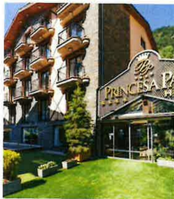
Votre hôtel 4*